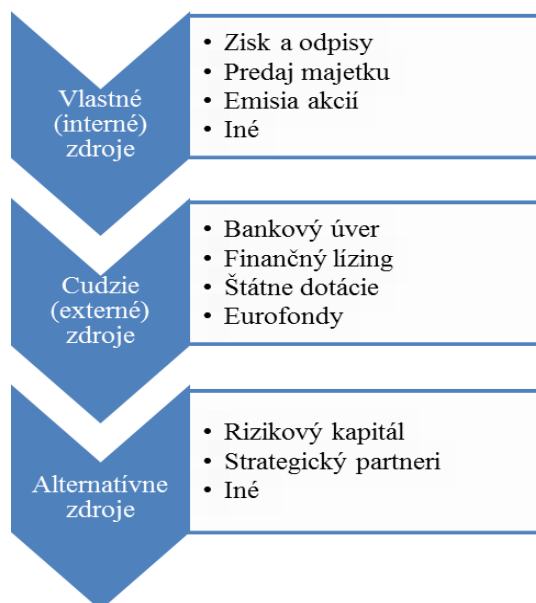
Obrázok 1 Klasifikácia zdrojov financovania projektov

Zdroje financovania projektu charakterizujeme ako peňažné prostriedky, slúžiace na úhradu investičných a prevádzkových nákladov projektu, ktoré sú poskytnuté samotným podnikateľským subjektom alebo subjektom externým. Zdroje financovania projektov všeobecne členíme na vlastné (interné), cudzie (externé) alebo alternatívne (vid'. obrázok 1).