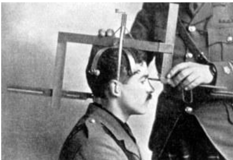
Obrázok 2 Meranie antropometrických znakov hlavy metódou bertilonáž

Začiatkom 20. storočia v práci Anglický trestanec: štatistická štúdia od Charlesa Buckmana Goringa (1870–1919) sa uvádza, že zločinci vykazujú nižšiu telesnú hmotnosť a sú nižšieho vzrastu ako „normálni ľudia“, čo podľa neho dokazuje, že zločinci sú na nižšom vývojovom stupni. V práci analyzoval dáta 96 znakov približne 3000 väznených zločincov [2].