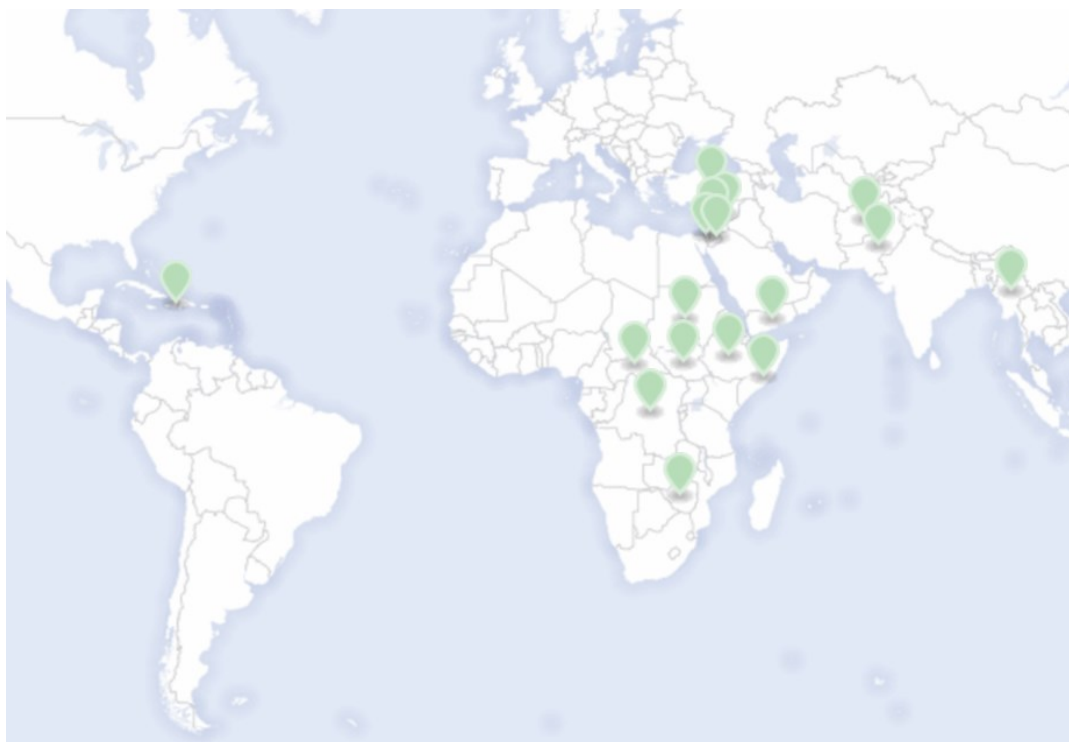
Obrázok 2: Krajiny v ktorých pôsobí CBPF [9]

CBPF (The Country-based pool fund) [9] finančné prostriedky krajín združené v tomto fonde slúžia ako nástroj na financovanie pomoci pri mimoriadnych udalostiach. Sú riadené OCHA (kancelária na riadenie humanitárnych záležitostí) na úrovni krajín pod vedením humanitárneho koordinátora. Príspevky do CBPF sú bezúčelové a po konzultáciách sa pridelia v rámci vybraných krajín. Mechanizmus je zriadený od roku 1995, keď bol založený prvý fond pre mimoriadne udalosti v Angole. Odvtedy CBPF pôsobila vo viac ako 20 krajinách. Na obrázku 2 sú zobrazené krajiny v ktorých tento fond pôsobí. Jedná sa predovšetkým o krajiny, ktoré boli na obrázku 1 označené ako krajiny s vysokou finančnou zraniteľnosťou (menej ako 100 ročné katastrofy spôsobia nedostatok zdrojov). V roku 2015 vyzbieral CBPF 591 miliónov dolárov.