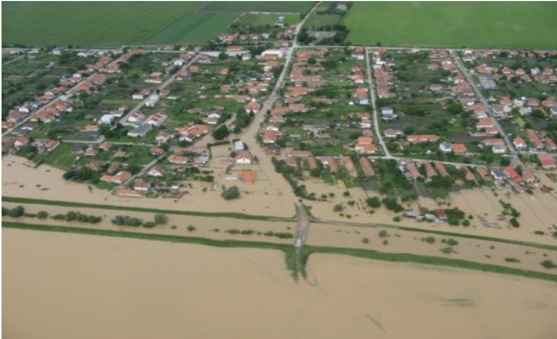
Obrázok 1 Povodne na Slovensku v roku 2014

Preventívne opatrenia na ochranu pred povodňami sú: